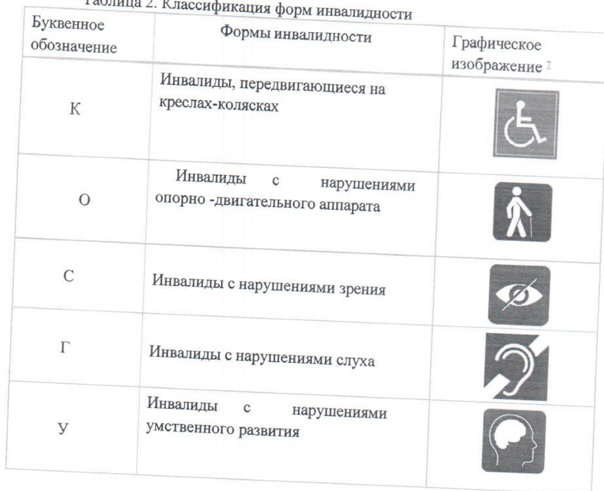
Таблица 2. Классификация форм инвалидности

В зависимости от формы инвалидности лицо сталкивается с определенными барьерами, мешающими ему пользоваться зданиями, сооружениями и предоставляемыми населению услугами наравне с остальными людьми.